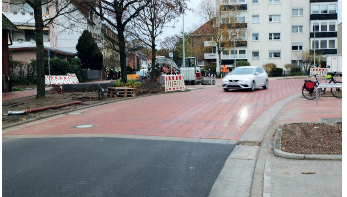
Ende November wurden die letzten Bauarbeiten an der Einmündung zur Obentrautstraße vorgenommen. Die Weizenfeldstraße war bereits fertiggestellt worden. Rote Aufpflasterungen erhöhen an manchen Stellen die Aufmerksamkeit.

Die Grunderneuerung ist das letzte große Projekt, das im Rahmen des Programms „Sozialer Zusammenhalt“ im Sanierungsgebiet Stöcken realisiert wurde. Die Kosten beliefen sich auf rund sechs Millionen Euro und wurden zum Großteil durch öffentliche Fördermittel des Bundes und des Landes Niedersachsen gedeckt.