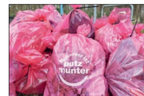
Säckeweise Müll: Der Frühjahrsputz hatte sich gelohnt.

Das Gemeindeholz wurde im März dieses Jahres einem gründlichen Frühjahrsputz unterzogen: Rund 20 freiwillige Helfer*innen beteiligten sich an der Aktion „Hannover ist putzmunter“. Sie sammelten entlang der Gemeindeholzstraße und dem Stöckener Bach jede Menge Müll. Zur Belohnung gab es anschließend Kaffee und Kuchen im Wohncafé in der Moorhofstraße. Die Aktion, zu der jedes Jahr in der gesamten Stadt aufgerufen wird, wird in den kommenden Jahren in Stöcken vom Stadtteilzentrum organisiert.