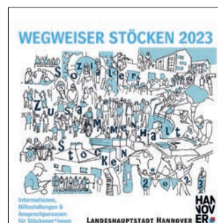
Der Wegweiser durch Stöcken enthält viele nützliche Informationen und Adressen. (Grafik: Stadt Hannover)

festellung sein. Sie wird in gedruckter Form im Stadtteil verteilt und kann als PDF von der Website www.stoecken.info heruntergeladen werden.