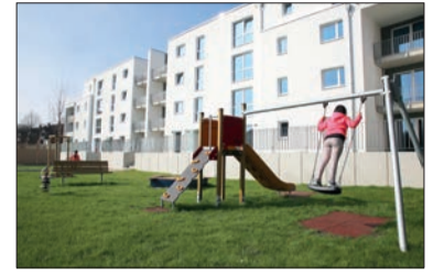
In Stöcken wird das Modellprojekt „Gesunde Lebenswelten“ gestartet. Vor allem für Menschen im Alter zwischen 35 und 55 Jahren sollen niedrigschwellige Angebote geschaffen werden, die der Gesundheit dienen. An der Weizenfeldstraße entstehen viele Wohnungen zu günstigen Mieten – darunter einige, die rollstuhlgerecht sind.