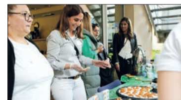
Zumba, Malen, Spiele und Kuchenbuffet: Alle Gäste kamen auf ihre Kosten.