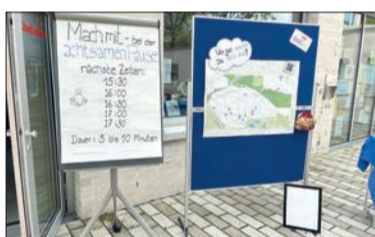
Auch Pausen wurden angeleitet – dabei kam es darauf an, achtsam zu sein.