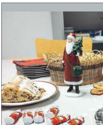
Die Vorweihnachtszeit wird durch das Quartiersmanagement versüßt.

net sich um 16 Uhr die Tür zum Wohncafé des Wohnprojekts WOHNEN PLUS. Die Veranstaltung geht bis 19 Uhr. Was in der Zeit passiert? Das wird nicht verraten. Am besten also vorbeischaun!