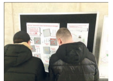
In einer Beteiligung konnten die Stöckener*innen ein Calisthenics-Gerät auswählen.

Moosbergstraße entsteht. Dort wird es unter anderem auch Reckstangen, eine Sprossenwand, Barren und eine Tischtennisplatte geben.