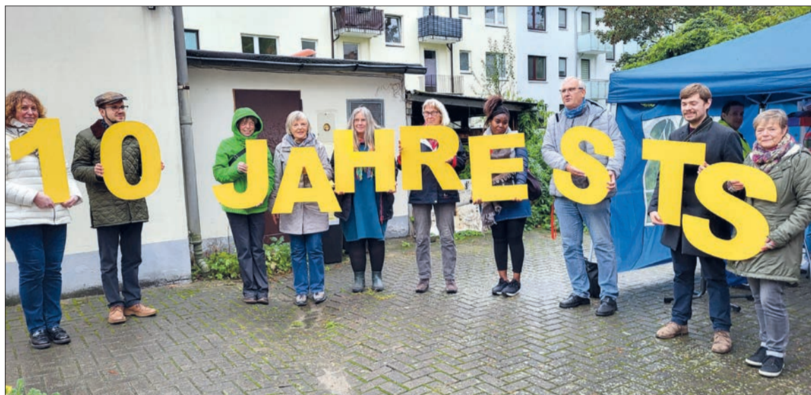
So stimmt die Reihenfolge: Am Ende der Performance war klar, wofür die Buchstaben und Zahlen standen.