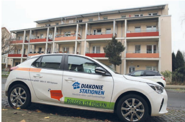
Neues Domizil: Die Diakonie Herrenhausen/ Nordstadt hat Räumlichkeiten im WOHNEN PLUS bezogen.

Zum Team gehören rund 40 Personen, darunter Pflegefachkräfte, Pflegehilfen und Haushaltshilfen. Birgit Bechinie koordiniert die Angebote im Wohncafé. Die Leitung der