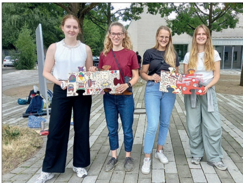
Die Studentinnen freuen sich über individuell gestaltete Puzzleteile.

Ziel der Veranstaltung sei es gewesen, die Bewohner*innen untereinander stärker zu verknüpfen, heißt es in der schriftlichen Auswertung des Projekts. Das Teilen von persönlichen Meinungen, Ansichten und Problemen fördere gegenseitiges Verständnis. Das Konzept basiere auf der Idee, dass jedes Individuum in der Gemeinschaft ein einzigartiges Puzzleteil darstelle, das am Ende zu einem Gesamtbild beitrage. Außerdem sei es darum gegangen, die Möglichkeiten, die der Platz auf dem Stöckener Markt bietet, besser zu nutzen und neue aufzuzeigen. Die Puzzleteile wurde eine Zeit lang im Stadtteilzentrum ausgestellt.