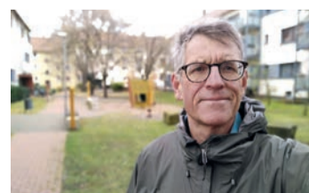
Der Redakteur vor einer der vielen schönen Freiflächen.

14 Jahre lang kenne ich Stöcken nun. Bald trennen sich unsere Wege. Einige Menschen werde ich in guter Erinnerung behalten, an viele Momente denke ich gern zurück. Und bestimmt komme ich wieder: Vielleicht fahre ich dann mit dem Fahrrad den Grüning am Stöckener Bach entlang, trinke einen Kaffee auf dem Stöckener Markt und besuche eine Veranstaltung im Stadtteilzentrum. Stöcken und ich werden uns nicht aus den Augen verlieren.