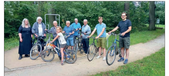
Neun von 26: Das Team beim diesjährigen Stadtradeln war nicht nur zahlenmäßig stark, sondern auch sehr aktiv: Insgesamt radelten die Teilnehmenden innerhalb von drei Wochen fast 6.800 Kilometer.

Kilometer. Das entspricht einer Strecke von Hannover bis Marrakesch in Marokko und zurück. Sie vermieden dabei rund 1.100 Tonnen des klimaschädlichen Gases CO 2 . Auch auf Hannover bezogen lässt sich das Ergebnis sehen: Das Team erreichte immerhin Platz 74 von 413 Teilnehmenden.