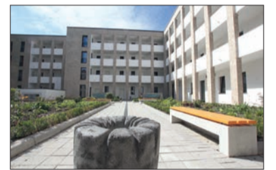
Wasser marsch! Die Einweihung des neuen Brunnens auf dem Stöckener Markt wurde ausgiebig gefeiert. Einige Gäste hatten Wasser mitgebracht, um den Brunnen symbolisch einzuweihen. Eingeweiht wurde auch ein Wohnhaus auf dem ehemaligen Gelände der St. Christophorus-Gemeinde, in dem unter anderem Menschen mit Handicaps leben.