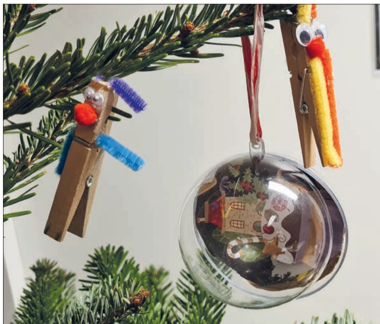
In der interkulturellen Spiel- und Lerngruppe wurde in diesem Jahr origineller Weihnachtsschmuck gebastelt.

Das Angebot wird von den Kindern mitgestaltet. Sie fühlen sich in der Gruppe wohl und geborgen. Außerdem können sie dort positive Erfahrungen sammeln. Viele Teilnehmende finden sich nun besser im Stadtteil zurecht. Die interkulturelle Spiel- und Lerngruppe fördere zudem die Integration, erschließe Ressourcen und